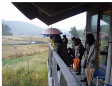
当日は残念ながら雨でした

当日は雨のため野外の見学はできませんでしたが、室内でガイドの方に中池見湿地の成り立ちや貴重な生き物について解説してもらいました。