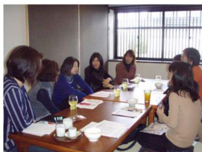
楽しい懇談会でした