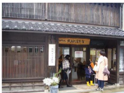
敦賀の古い町屋を見学しました

仕事と家庭の両立や、会社での悩みなどについて話合いました。テーマはちょっと重かったのですが、笑い声が絶えない楽しい懇談会となりました。