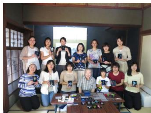
▲オリジナルの作品とともに