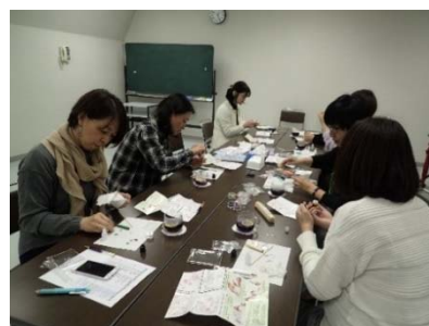
【ハーバリウムボールペン製作の様子】