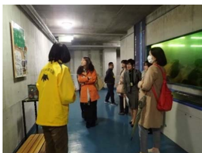
【魚津埋没林博物館で解説を受ける様子】

家庭と仕事の両立、会社内での上司と部下との間で起こる悩みや課題、若い世代への指導方針、女性社員が活躍するための会社での取り組み状況などについて話し合いました。新しいメンバーが増える一方で、残念ながら家庭の事情等で退職された方も複数名いらっしゃいました。新しい交流が広がり、楽しく有意義な時間であったとともに、改めて介護問題や今後の働き方について考える機会となりました。